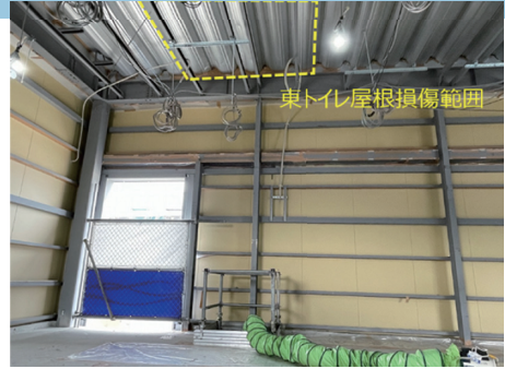
爆発事故でトイレの天井に10箇所の凹み「床100㎡の損傷」との事故報告から2月後、爆発の激しさを物語っています。

熱中症 大阪府では「最も多い月では4,000人を越える人が救急搬送」、会場では「夏季イベント等で人が集まる空間では、熱中症の危険が高まる」。